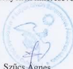
Szűcs Ágnes intézményvezető